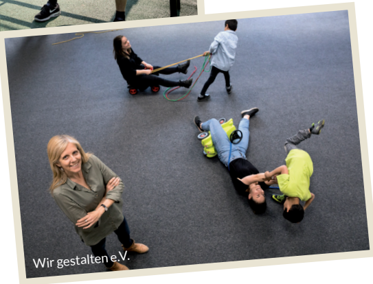
Wir gestalten e.V.

Oben: Schirmherrin Bundeskanzlerin Angela Merkel auf der Preisverleihung 2018