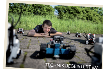
TECHNIK BEGEISTERT e.V.

Sie verfügen über Berufserfahrung und möchten ehrenamtlich etwas Sinnstiftendes tun? Sie möchten sich dabei in einem zeitlich abgesteckten Rahmen mit Ihrem Know-how und Ihrer Erfahrung engagieren?