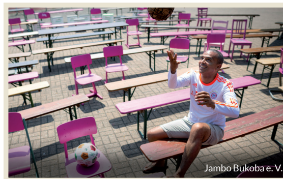
Jambo Bukoba e.V.