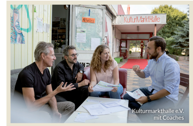
Kulturmarkthalle e.V. mit Coaches