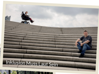
Inklusion Muss Laut Sein

Unter dem Motto „Hilfe für Helfer“ vergibt startsocial jährlich 100 viermonatige Beratungsstipendien und 25 Auszeichnungen, darunter sieben Geldpreise, an herausragende soziale Initiativen. In jeder Wettbewerbsrunde bringen rund 500 Fach- und Führungskräfte als ehrenamtliche Coaches und Juroren ihr Know-how ein. Der Wettbewerb wird seit 2001 veranstaltet und ist damit Pionier in der Beratung ehrenamtlich getragener sozialer Initiativen in Deutschland.