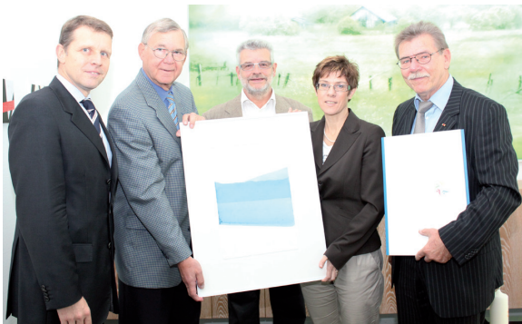
Unser Bild zeigt die Übergabe der Bürgeraktie an die neue Ministerpräsidentin Annegret Kramp-Karrenbauer.